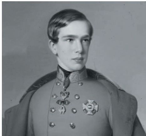
J. V. rakouský císař František Josef I.

Dne 25. srpna ráno o 5. hodině ruský dvorní vlak, ozdobený zemskými barvami ruskými, rakouskými a haličskými, vjel do nádraží Ščakovského a o 9. hodině do Bohumína. Císař a král František Josef I. s korunním princem Rudolfem vjel z Kroměříže carským hostem vstříc o 11. hodině do Hulína. Ruský dvorní vlak přibyl tam o 12. hodině. Císař a korunní princ byli pozdraveni od carevny a velkokněžny Marie Pavlovny z vozu přivítavým úsměvem a kynutím hlavy. Jak vlak zastavil, vstoupili do vozu, kdež dalo se vzájemně přivítání. Hned na to hnul se vlak ke Kroměříži, kdež přibyl o polední. Na nádraží čekala císařovna Alžběta s arciknížetem Ludvíkem. Vojenská hudba zahrála carskou hymnu. Císařovny objaly a políbily se dvakrát. Car Alexander III. oblečen v rakouskou uniformu plukovníckou, na prsou stužku svatého Štěpána, vstoupil z vozu a prohlížel s císařem čestnou