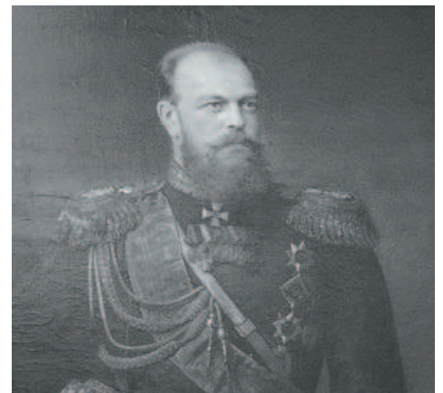
J. V. ruský car Alexandr III.

setninu. Vraceje se z přehlídky car přistoupil k císařovně rakouské a políbil ji ruku. Představování a přijímání přítomných nejvyšších hodnostářův dvorských, zemských a městských trvalo asi čtvrt hodiny, načez vznešené panstvo jelo do zámku ve čtyřspřežních vozech, napřed oba panovníci, pak panovnice, velkokněžna Marie Pavlovna s následníkem carevičem, velkokníže Vladimír s korunním princem Rudolfem, arcikníže Karel Ludvík s velkoknížetem Jiřím. Zástupy lidu provolávaly «Sláva!» a «Urál!». Cara na krátké cestě, kudy projeli musil lidem, patrně překvapovalo ruské volání «Urál!». Odpoledne po 6. hodině hosté začali sjížděti se ke dvorní tabuli. I talíře byly z ryzho zlata. U každého místa bylo napsáno jméno hosté. Císařské rodiny zasedly po obou stranách a uprostřed. Císařovny zaujaly čestná místa. O 8.