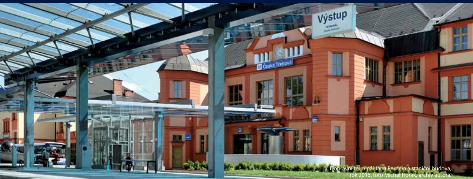
Dopravní terminál Jana Pernera a staniční budova, rok 2016, foto Michal Horák, archiv autora.