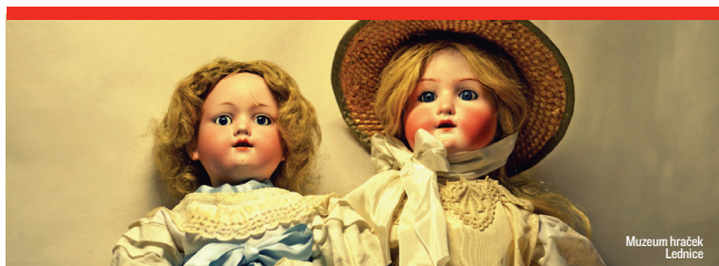
Muzeum hraček Lednice

Nechte se okouzlit nostalgií vzniku historických hraček z 19. a 20. století a vraťte se do svého dětství v muzeu plným retro medvídků a panenek.