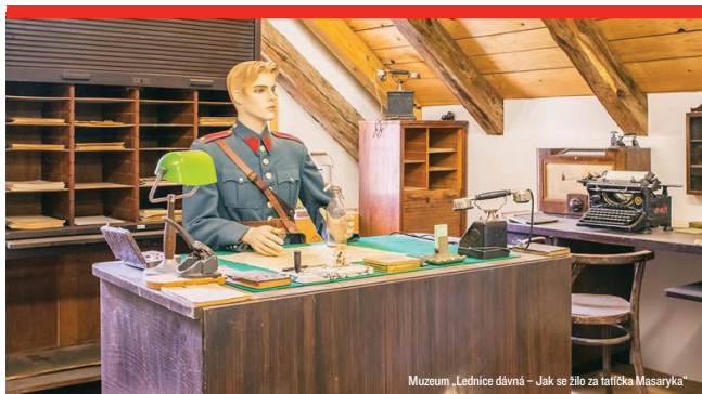
Muzeum „Lednice dávná – Jak se žilo za tatíčka Masaryka“

Přeneste se zpět do období první republiky v muzeu na Zámeckém náměstí v budově Infocentra s názvem „Lednice dávná – Jak se žilo za tatíčka Masaryka“.