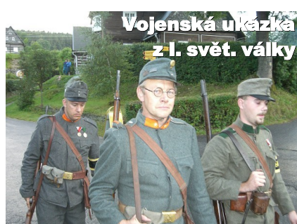
Vojenská ukáзка z I. svět. války