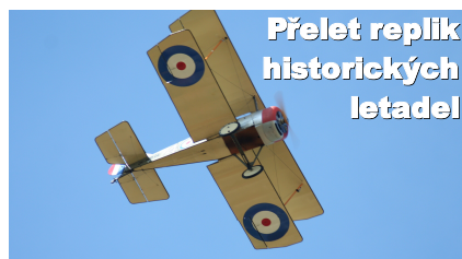
Přelet replik historických letadel